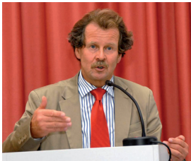
Manfred Nowak, Jurist

Die Universität Wien hat – nach positiver internationaler Begutachtung – mit 2008 die Forschungsplattform „Human Rights in the European Context“ eingerichtet. Somit gibt es derzeit sieben Forschungsplattformen, die mit der Zielsetzung eingerichtet wurden, innovative neue Forschungsfelder an der Universität Wien zu verankern.